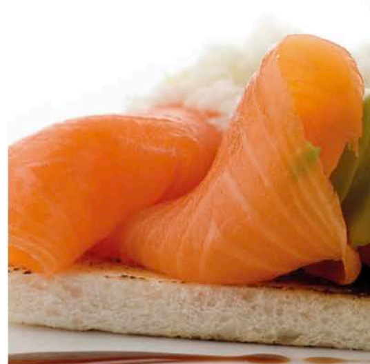
Salmón Fripozo Ahum.80g

€/ud. 5,89 € Brocoli Decasa Florette Bol.2,5k.