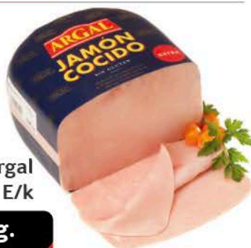
Jamón Argal Cdo.s/m E/k

€/ud. Queso Especial 8,49 € Host. Edam Lonch.1k