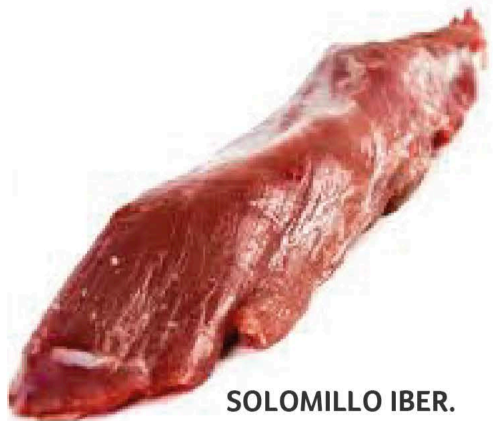
SOLOMILLO IBER. CONG. E/K