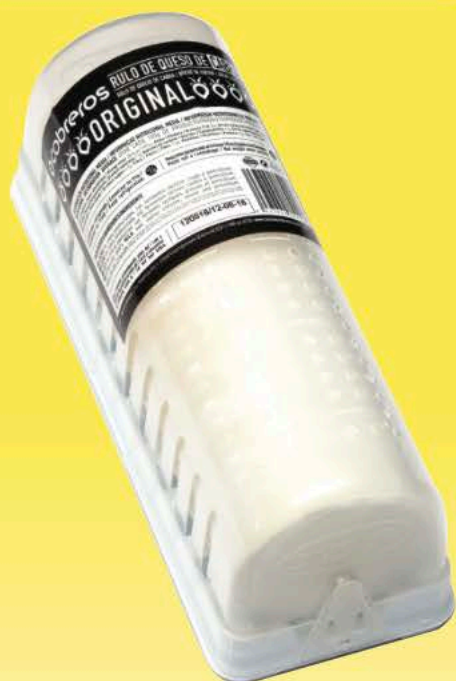
QUESO TGT CABRA-VACA RULO 1K