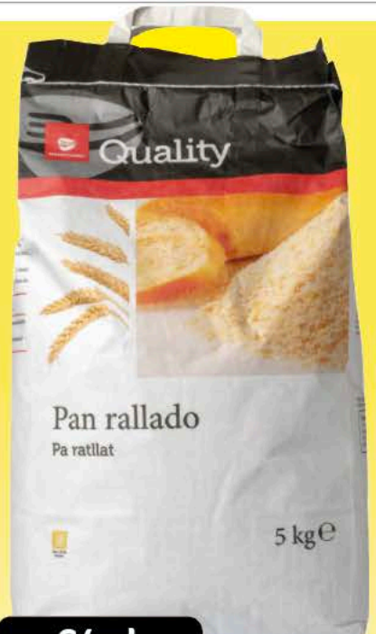
Pan rallado Pa ratllat