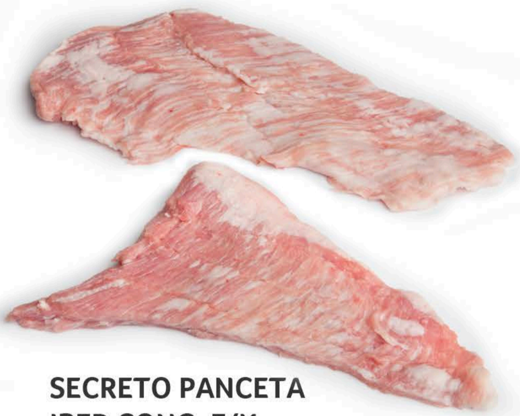
SECRETO PANCETA IBER.CONG. E/K