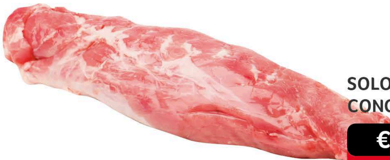
SOLOMILLO CERDO CONG