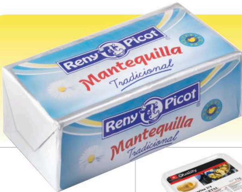
MANTEQUILLA RENY PICOT 1K