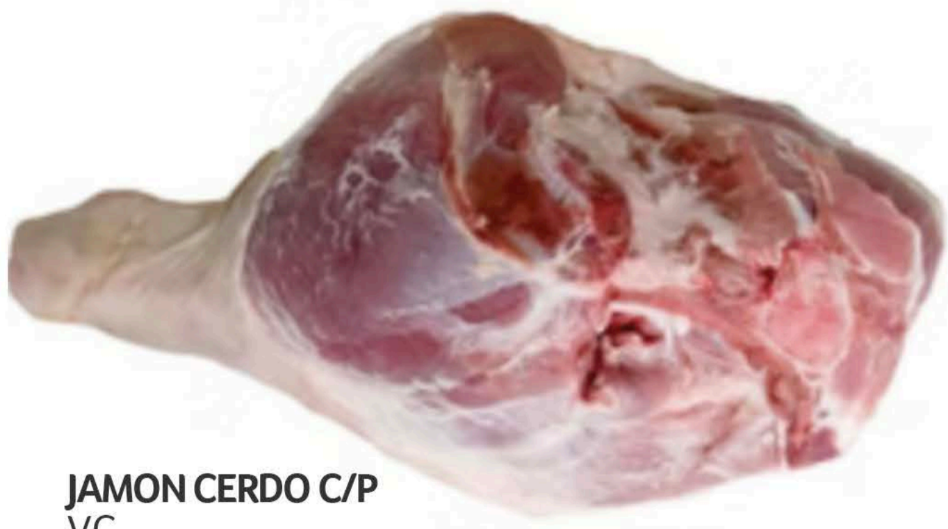
JAMON CERDO C/P VC.