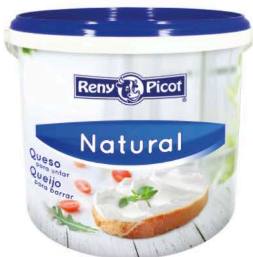
Queso Reny Picot Untar 5k