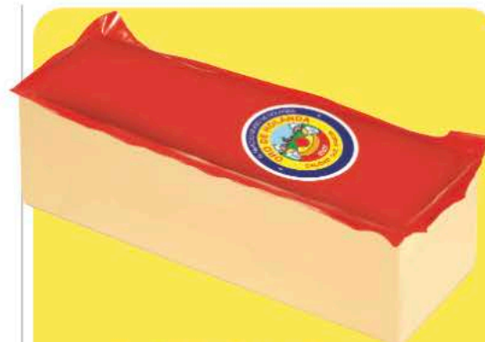
QUESO ORO HOLAN. EDAM BARRA

€/ud. Queso Reny Picot 14,99 € Crema Cubo 2k