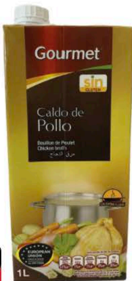
Caldo Gourmet Pollo Brick 1l