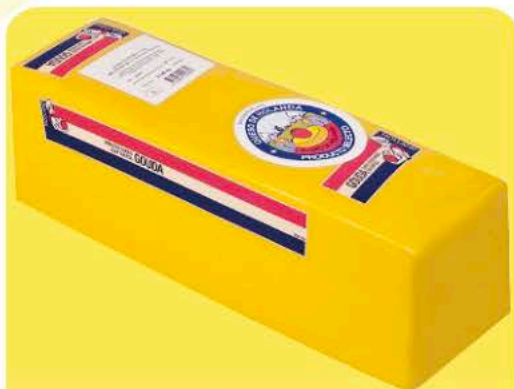
QUESO ORO HOLAN. GOUDA BARRA