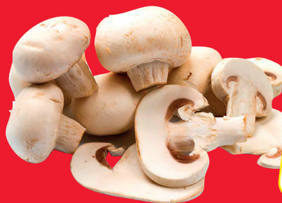
CHAMPIÑÓN ENTERO CAJA 2,5 KG. APROX.