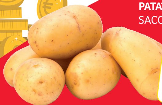
PATATA BLANCA SACO 25 KG.