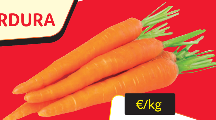
ZANAHORIA BOLSA 5 KG.